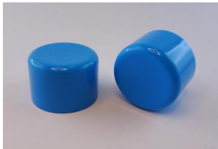
H-3415RB62 Softline with rounded bottom edge