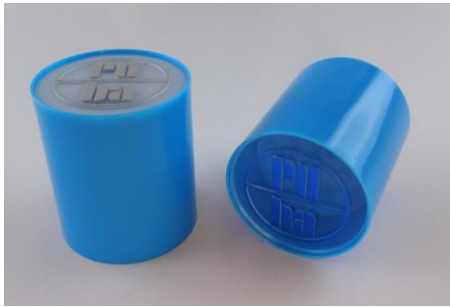
H-34152PL2 2 Parts Longline