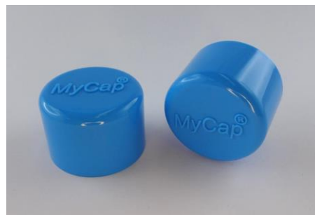
H-3415Logo Softline with Logo