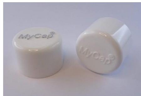
H-3415Logo Softline with embossed Logo

Verschlüsse mit einem Logo, spezieller Riffelung, Softtouch, einem Sonderdesign, leichter, schwerer, höher, tiefer... Das und noch vieles mehr!