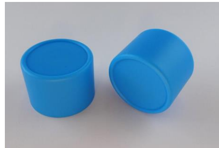
H-3415K2 Kingsline + Softtouch