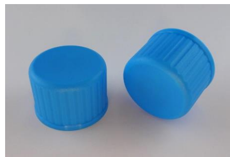
H-341539-0.6 Lightline 30% less material