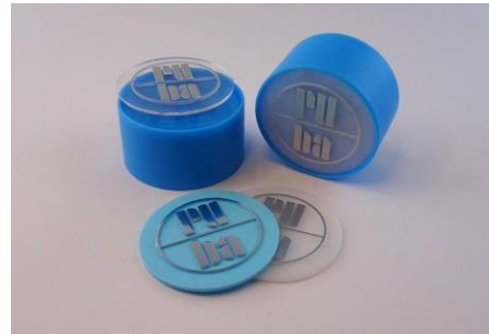
H-34152P 2 Parts Classicline