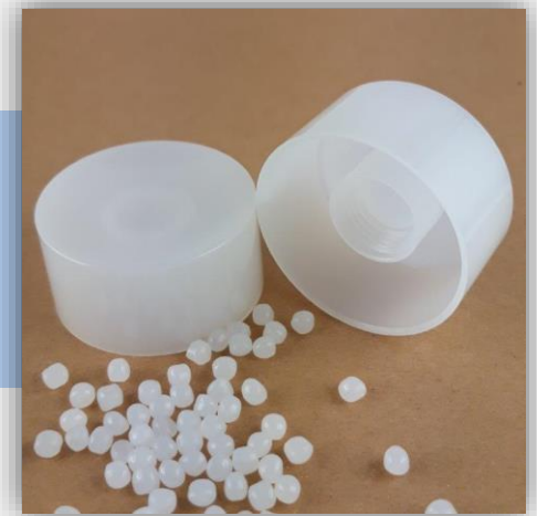
Purell GB7250 HD PE ISO 10933 - Évaluation biologique pour application médicale