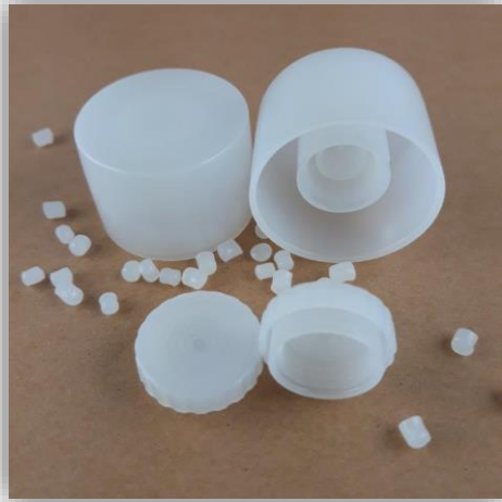
Sabic M1053 HD-PE

Désormais, nous proposons également nos bouchons en PE. Cela signifie que vous pouvez mettre sur le marché un monotube avec un bouchon RUBA. Nous avons échantillonné avec succès les matériaux répertoriés ci-dessous: