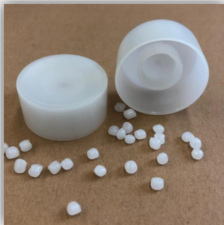
HD4527 Terralene PE biosourcé, contient des charges minérales Proportion de BCC (Biobased Carbon Content) : 95%

Êtes-vous confronté à de nouvelles demandes de clients?